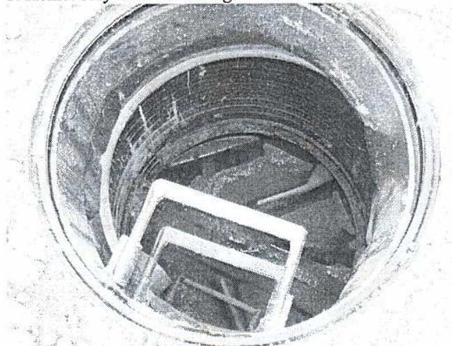
3 Studzienka na kanale grawitacyjnym w m. Chytra