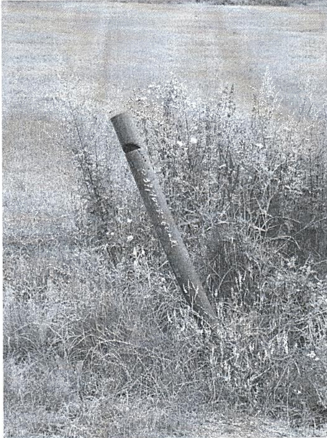
1. Koniec rury kanału tłoczego w Dubinach

Nazwa zadania: „Usprawnienie gospodarki ściekowej poprzez rozbudowę sieci kanalizacyjnej w miejscowości: Nowosady-Sorocza Nóżka, Przechody, Dubiny-Postołowo, Sawiny Gród, Bielszczyzna –Hajnówka, Wygoda –Hajnówka, Puciska –Czyżyki-Nowoberezowo, Dubicze Osoczne-Chytra”