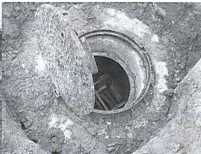
5 Wykop pod kanalizację grawitacyjną i tłoczną, m. Puciska 6. Studzienka na kanale grawitacyjnym w m. Puciska