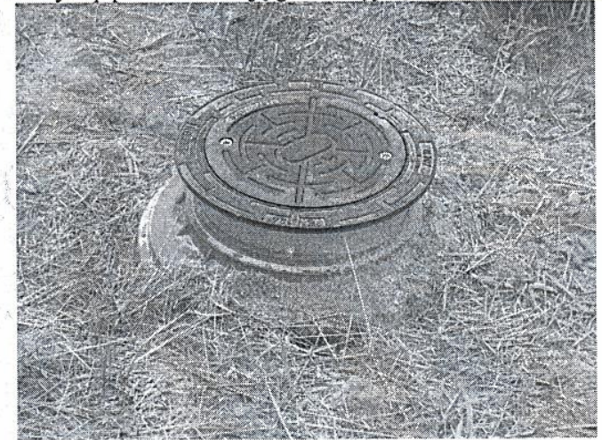
4. Studzienki na kanale grawitacyjnym w m. Wygoda